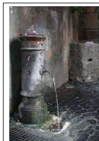
Un “NASONE” di Roma